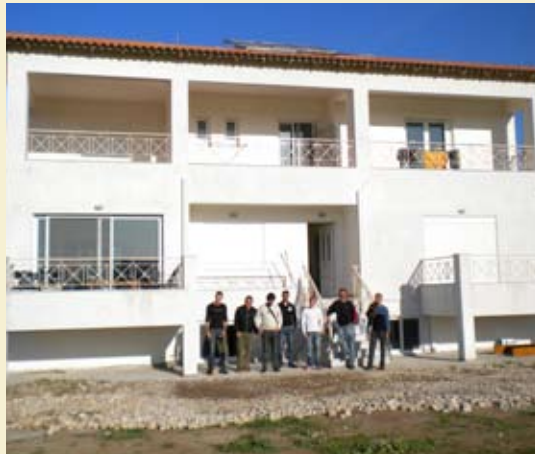
Το νέο κτίριο στη Θήβα